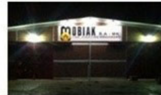
MOBIAK Balkans Branch (F.Y.R.O.M)