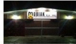
MOBIAK Balkans Branch (F.Y.R.O.M)