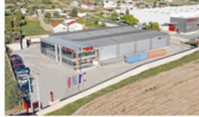
Lager in Athen, Griechenland