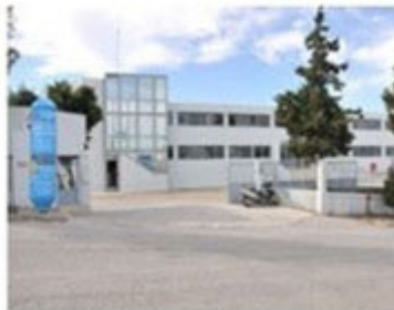
Lager in Heraklion, Griechenland