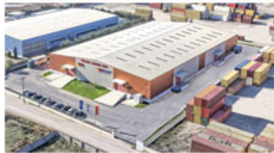
Lager in Thessaloniki, Griechenland