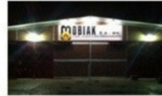
MOBIAK Niederlassung, Balkan (FYROM)