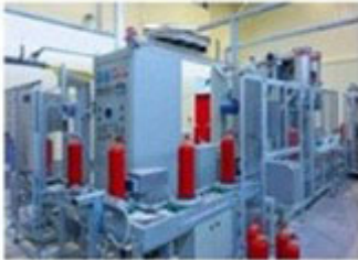
Automatic Production Line