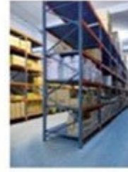
Warehouse in Crete