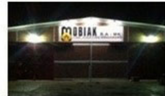
MOBIAK Balkans Branch (F.Y.R.O.M)