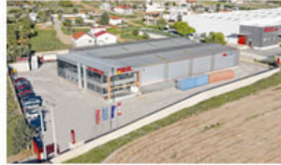
Warehouse in Athens - Greece