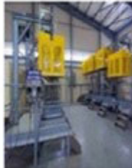
Gas Bottling Unit