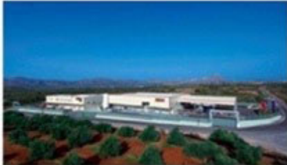
Central facilities – Factory in Chania – Crete- Greece