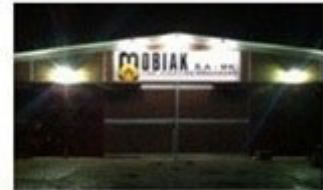
MOBIAK Balkans Branch (F.Y.R.O.M)