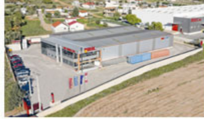
Warehouse in Athens - Greece